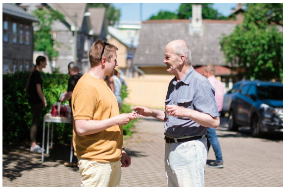
Vestlused. Ausad vestlused aitavad Jumalale lähemale.

kutsuvat sõbralikkust ja nähtavat armastust. Mõne keskkonna puhul oleme hakanud iseennast teenima, sest meil on mugav ja hea koos olla. Me tahame seda muuta, et olla valmis uute inimeste tervitamiseks, ilma surve ja võõristuseta. Vaatame ka väikegrupid üle selle pilguga, et me ei kaotaks evangeelset väljundit! Laseme Jumala Vaimul teha oma tööd, ja aitame kaasa. Siis kasvame ka ise usus.